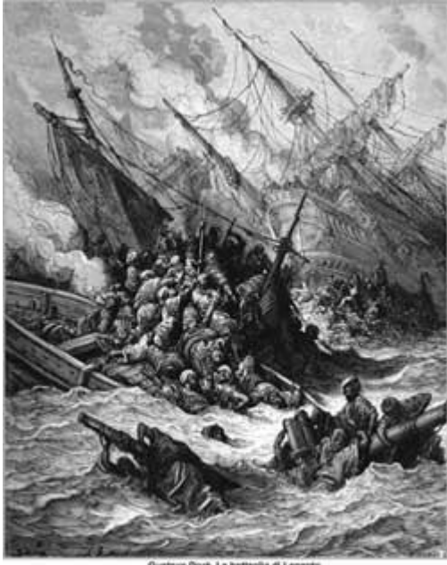
Gustave Doré, La battaglia di Lepanto

La batalla se desencadenó en el golfo de Lepanto. Tronaba el cañón, las gabarras descargaban su metralla, las bombardas disparaban contra las embarcaciones, las naves embestían, el humo cegaba y casi oscurecía el sol, las aguas se teñían de sangre... las voces de miles de cristianos en todo el mundo subían clamorosas al cielo rezando el Rosario, en la iglesia de Minerva se organizó una procesión rezando el rosario. El Papa Pío V, desde el Vaticano, no cesó de rezar con las manos elevadas como Moisés. Don Juan de Austria ayudado por Colonna y el general Venieri dirigía el centro Andrea Doria el ala derecha y Agustín Barbarigo la izquierda. Pedro Justiniani y Pablo Jourdain estaban en cada extremo de la línea. Don Juan enarboló la bandera enviada por el Papa con la imagen de Cristo crucificado y de la